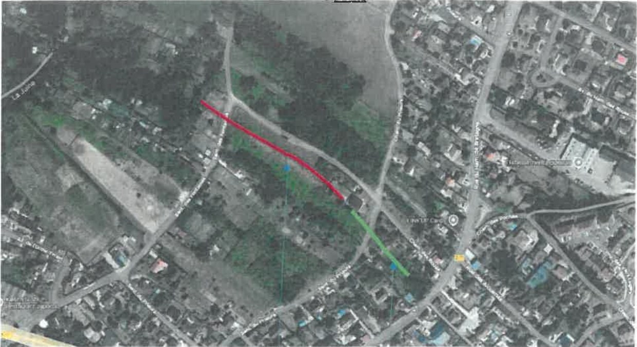
Sentier des Rouas