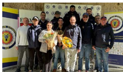
Les bénévoles du VCE à l'issue de la course.

Le 28 septembre, le coup d'envoi du Grand Prix du Conseil municipal-Course de la Saint-Michel a été donné devant l'entrée principale de l'île de loisirs.