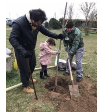
Plantation d'arbres à Chalou-Moulineux

Nous vous proposerons également de vous engager dans des actions en partenariat avec d'autres associations : chantiers nature, soins aux animaux (reptiles avec SOS p'tites bêtes).