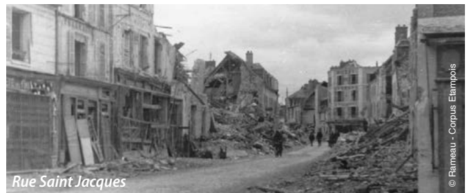
Rue Saint Jacques