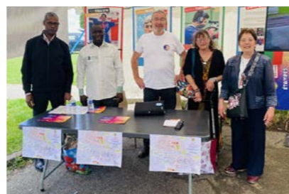
À Guinette en Fête.