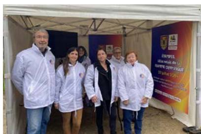
À Mars Bleu.