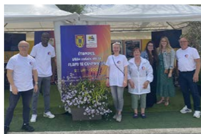
À la Foire de l'Essonne Verte.