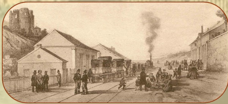
Étampes, halte du train des messageries d'après Champin, 1845

Les conférences se tiennent à 15h30 salle Saint-Antoine