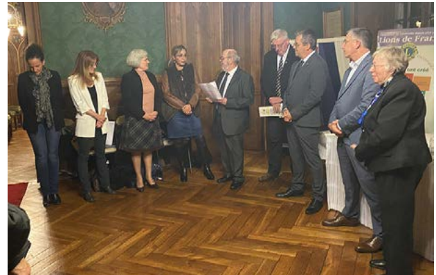
La campagne de sensibilisation a été lancée officiellement le 20 novembre à l'Hôtel de Ville.

A u 11 novembre dernier, on recensait 114 féminicides depuis le début de l'année 2023, ainsi qu'une augmentation de 41 % des actes de coups et blessures dans les familles constatée depuis la crise du Covid en 2020. Des données alarmantes qui incitent à la mobilisation. Depuis plusieurs décennies, notre société sensibilise activement à la lutte contre les violences faites aux femmes, informant sur les différentes formes de violences, physique et mentale. En 1999, l'Organisation des Nations Unies (ONU) a désigné le 25 novembre comme la Journée internationale pour l'élimination de la violence à l'égard des femmes. Cette année encore, la Ville d'Étampes se joint à ce mouvement solidaire, s'associant à des alliés fidèles et locaux pour toucher un maximum de personnes.