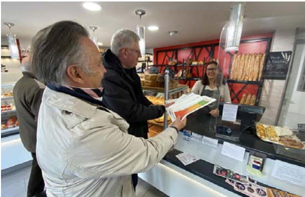
Pour la 1 re édition en 2022, 100 000 sacs avaient été distribués en collaboration avec les boulangeries.