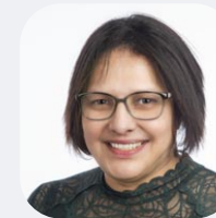
Sabah AÏD ► Personnes vulnérables et Aînés.