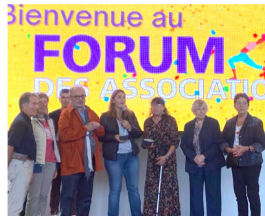
Le Rotary Club et le Lions Club d'Étampes , pour leurs actions, notamment la collecte pour le peuple ukrainien.