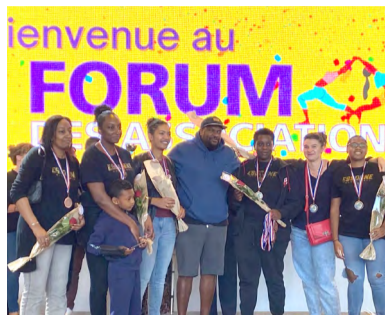
L'équipe féminine du Basket Club Étampois , pour sa victoire au championnat départemental senior et son passage en ligue régionale.