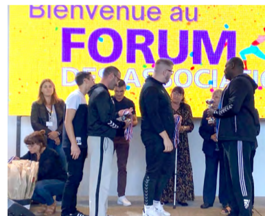
Le Collectif Seniors masculin du Club Handball Étampois , pour sa victoire en championnat départemental excellence et son passage en ligue pré-régionale.