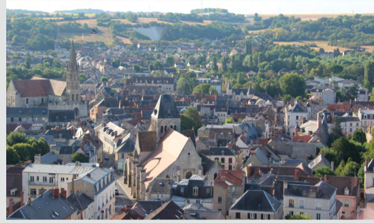
Vue Étampes et Église depuis la tour de Guinette

Afin de mener l'enquête publique concernant la modification de droit commun du Plan Local d'Urbanisme, portant sur des points spécifiques (voir site Internet >Actu >Enquête publique), le dossier complet est toujours disponible en ligne et consultable en format papier au Service Urbanisme, situé à la Maison des Services Publics Municipaux (12, Carrefour des Religieuses, Étampes). Pour rappel, cette enquête publique se déroule depuis le 22 août jusqu'au 22 septembre. Les Étampois peuvent faire part de leurs observations en remplissant le registre d'enquête publique, à disposition au Service Urbanisme, situé à la Maison des Services Publics Municipaux ; ou directement au commissaire enquêteur, en adressant un courrier à l'adresse suivante : Mairie, place de l'Hôtel-de-Ville et des Droits-de-l'Homme, 91150 Étampes ; ou en rédigeant un mail à l'adresse suivante : urbanisme@mairie-etampes.fr Le commissaire enquêteur tiendra une dernière permanence à la Maison des Services Publics Municipaux jeudi 22 septembre, de 13 h 30 à 17 h. Renseignements et informations au : 01 60 81 60 39.