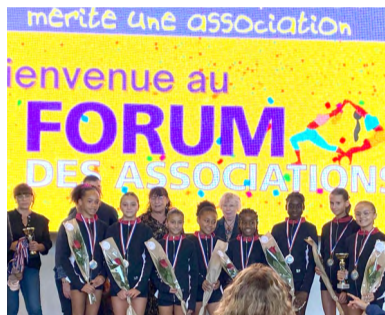
L'Entente Gymnique Étampoise 10-15 ans , pour ses victoires en championnats.