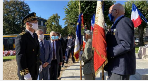
Au premier plan, à gauche, le nouveau sous-préfet salut les Anciens combattants.

d'Étampes. Il a aussi immédiatement émis le souhait de rencontrer les élus. « J'arrive de Polynésie Française où j'ai servi pendant deux ans en tant que directeur de cabinet. Je vais prendre le temps de découvrir les enjeux de l'arrondissement d'Étampes et du département. Ma priorité est de prendre contact rapidement avec les élus pour qu'ils m'expliquent les enjeux du territoire, les dossiers prioritaires. Ils vont me raconter l'histoire d'Étampes, de l'arrondissement, du département et après les avoir écoutés, nous verrons ensemble comment nous pouvons avancer avec ce partenariat permanent entre l'État et les élus. Chacun dans son rôle, pour faire avancer les choses, dans un contexte très particulier puisque la crise sanitaire a impacté fortement tous les territoires de France. Un plan de relance ambitieux a été annoncé par le président de la République et le Premier ministre et donc, là aussi, il y a un enjeu fondamental, un enjeu prioritaire à accompagner les territoires dans cette relance avec cette crise