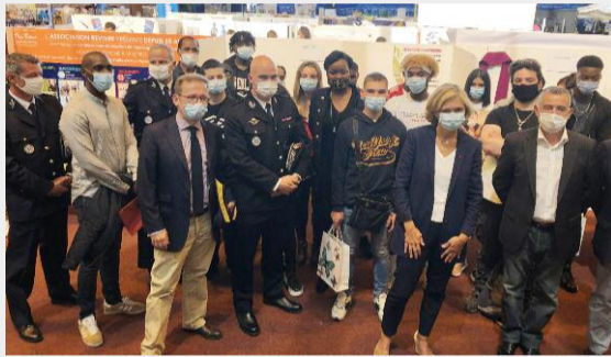
Centre de secours des sapeurs-pompiers d'Étampes. Ils ont œuvré avec courage dans les cages d'escaliers pour nettoyer, gratter, et repeindre. Nous sommes fiers de la jeunesse à Étampes. Vive Étampes ! », a déclaré le maire et député honoraire. Les 22 jeunes vont obtenir une aide à la formation au permis de conduire.