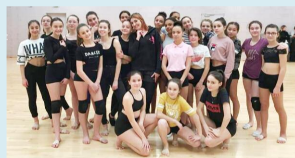
Stage organisé en décembre 2019 avec le groupe ados Lyrical Contemporain Jazz.