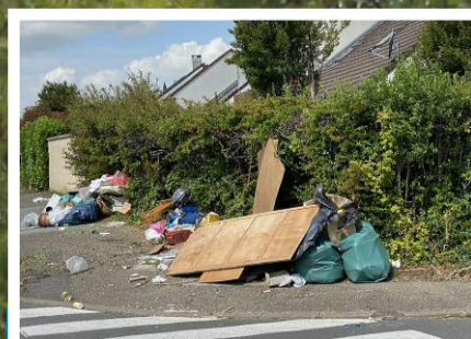
P5 / Environnement : le ton monte face aux incivilités