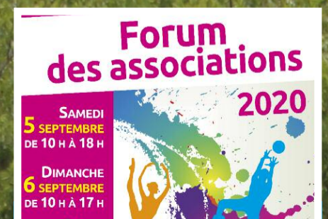
P8 / Le nouvel élan du Forum des associations