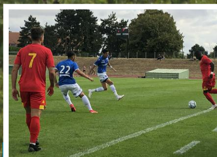
P7 / AJA- Le Mans FC : un match d'exception