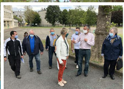
P3 / Rentrée scolaire : la Ville aux commandes