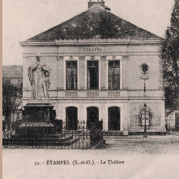
32. - ÉTAMPES. (S.-et-O.). - Le Théâtre