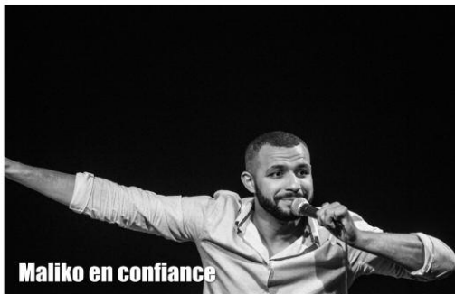
Maliko en confiance

V : représentation programmée par la ville aux Grands Solistes