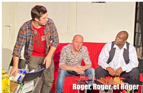
Roger, Roger, et Roger