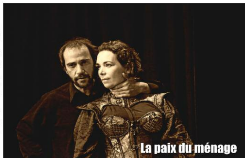
La paix du ménage

La paix vue par Maupassant, un couple vu par Maupassant... ce n'est pas du vaudeville. C'est du Maupassant. Une pièce à la fois drôle et glaçante, au féminisme inattendu.