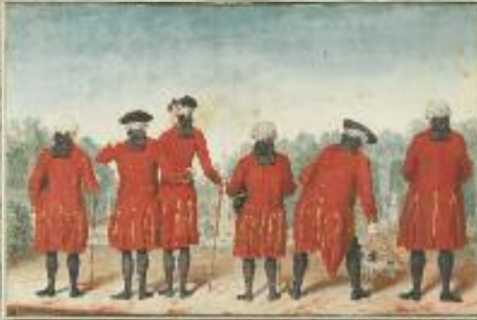
Louis Carrogis, dit Carmontelle, Les gentilshommes du Duc d'Orléans en costume de Saint-Cloud, gouache.